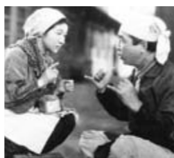
▲名もなく貧しく美しく

とき 6月17日(土)～同23日(金)・10時30分～・19時20分～(19日(月)、21日(水)のみ)・21時10分～(17日(土)のみ)