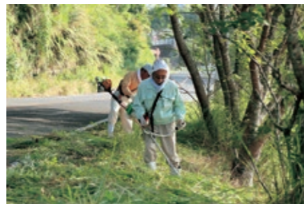
▲有志によるコース整備