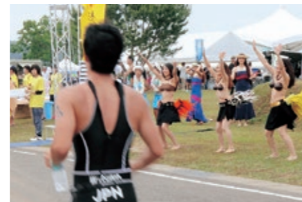
▲タヒチアンダンスでお出迎え