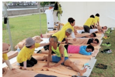
▲選手を癒やすマッサージ