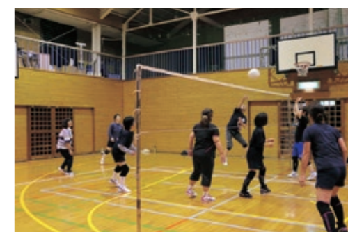
▲いつも笑いが絶えないメンバー