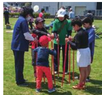
▲キャッチング・ザ・スティックを楽しむようす

スポーツ推進委員は、地域や市のスポーツイベントの企画運営の他に、ニュースポーツの紹介や指導を行っています。 ニュースポーツは、競うことより楽しむことを目的に新しく考案されたスポーツのことです。いつでも・だれでも・どこでもできるものです。実際に体験して、その楽しさやルールなどを学習し、みなさんに合うスポーツを紹介しています。競うものではないので、紹介する我々が上手にできなくてもいいのでプレッシャーがなくていいんです。