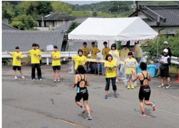
▲選手にドリンクを渡すボランティア

コース整備のための除草作業、給水所や交通整理員、フィニッシュする選手を出迎える踊り手たち、レース後の選手を癒やすマッサージなど多くの人たちの協力がありました。