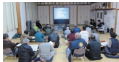
▲下南町まちづくり検討会