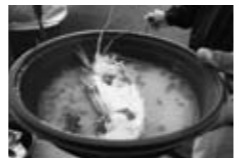
▲伊勢えびのみそ汁

※このほか、特産品ギフトセ ット展示予約会や農産物品 評会なども行います。3日 ③には、伊勢えびのみそ汁 の販売(1杯1,000円、100 杯限定。午前11時から整理券配布)、天草黒牛 の肉の販売(午前10時30分～)も行います。