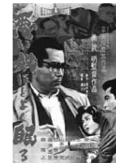
▲悪い奴ほどよく眠る