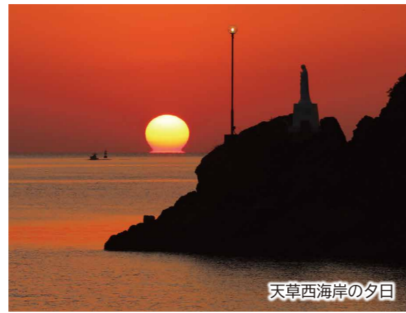
天草西海岸の夕日