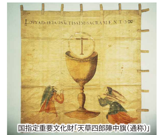
国指定重要文化財「天草四郎陣中旗(通称)」