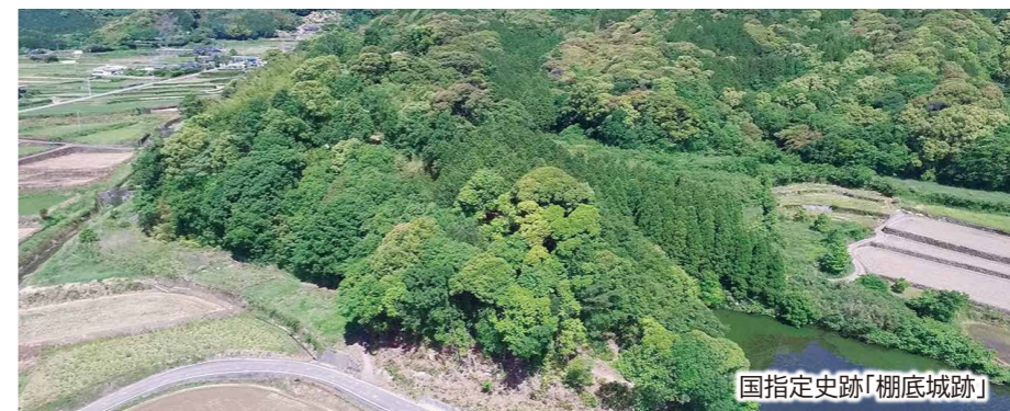
国指定史跡「棚底城跡」