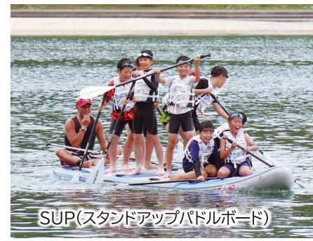
SUP(スタンドアップパドルボード)