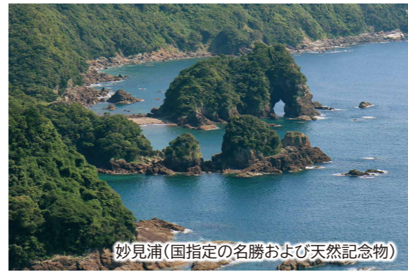
妙見浦(国指定の名勝および天然記念物)