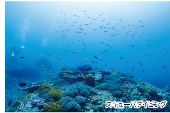
スキューバダイビング