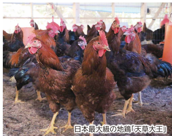
日本最大級の地鶏「天草大王」