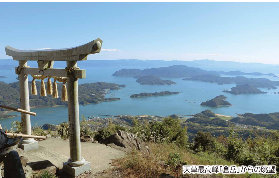
天草最高峰「倉岳」からの眺望

3方向を海に囲まれた天草市には豊かな自然、絶景スポットや自然を生かしたアクティビティ、海の幸や山の幸、古くから伝わる伝統や文化があります。