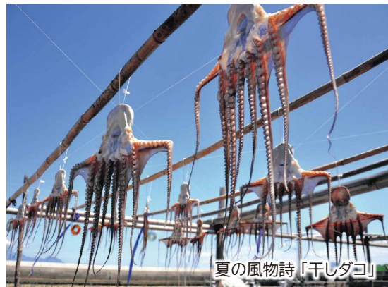
夏の風物詩「干しダコ」