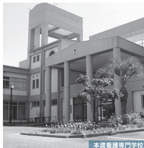
本渡看護専門学校

※東京藝術大学との連携事業以外の主な事業については、6〜7ページで紹介しています。