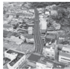
▶諏訪交差点側からの完成イメージ

質疑 問 計画期間を1年間延長した理由は。 答 新型コロナウイルス感染症拡大の影響により、計画していた用地交渉に遅れが生じたため、1年間期間を延長して、令和7年3月末の事業の完成を目指す。