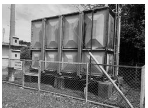
▲地域で管理する小規模水道施設

経済部長 「あまくさ事業承継サポート会議」を設立し、オール天草の体制による事業者への啓発と事業承継の取組を支援していく枠組みを構築した。今後も事業承継の機運を高め、天草エリアで事業承継に悩む事業者の一助となるよう、関係機関と連携し、より円滑な事業承継が促進されるよう必要な支援に取り組んでいきたい。