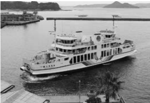
▲牛深港と長島港を結ぶフェリー

浜崎 うしぶか海彩館2階の牛深港観光案内所跡を「夕陽の駅」にできないか。「道の駅」「海の駅」を生かし、相乗効果で必ず盛り上げられると思われる。また、ウッドデッキや24時間開放の休憩所の見直し、トイレ改修など早急な対応をお願いする。