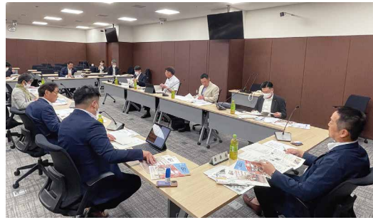
▲広島県呉市の取組を学ぶ本市議会広報広聴委員

その手段として、表紙やレイアウトの工夫のほか、紙面に市民の皆様の声などを掲載するなど、興味を持ってもらえるような取組をされました。