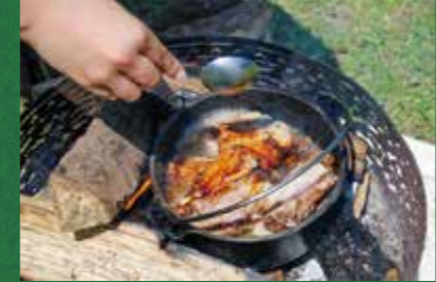
②肉に火が通ったらしょうゆを加えてさらに煮込む