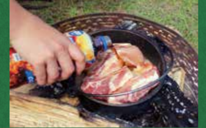
①スペアリブにコーラを入れて煮込む