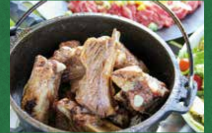
③10分ほど煮込んだら完成