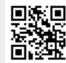
▲詳細はこちら(9月4日から公開)