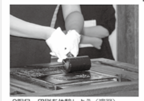
2限目 印刷を体験しよう（演習） グーテンベルク印刷機を使って、実際に印刷を体験します。