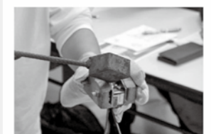
1限目 活字を鋳造しよう（講義・実演） 印刷する文字の型づくりを行います。