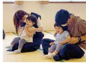
▲ ツインズカフェで子どもと触れ合う参加者

産後1年未満のお母さんを対象に、お母さんとその家族が参加できるベビーマッサージ交流会などを行っています。また、パパが主役の「papatoko カフェ」も開催しています。パパ同士が交流する機会をつくることで、つながりの輪が広がっています。 ・ファミリーカフェ ・ツインズカフェ ・papatoko カフェ など