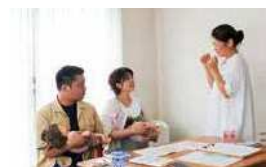
▲ 赤ちゃんの抱っこの仕方や寝かせ方などをレクチャー

初めての妊娠で分からないことばかりだった上に、4月に天草に引っ越して来たばかりで、周りに相談できる人がなくて不安でした。妊娠8ヵ月面談を受けて、助産師さんとなりがりできたのが一番良かったです。出産の流れや産後のことなど、分からないことをいつもネットで調べているのですが、実際に助産師さんとお話しすることで、自分では分からないことが分かってホッとしました。面談では、妊娠中の体のことも相談できました。ずっと腰とお尻が痛かったのですが、体操やストレッチなどの骨盤ケアをしてもらってかなり楽になりました。家でできるストレッチを教えてくださいましたので、自分でもやってみようと思います。周りに知り合いがいなくて、普段話をするのも夫だけなので、このようなサポートがあると安心です。