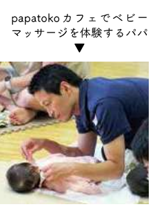
papatoko カフェでベビーマッサージを体験するパパ