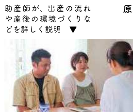
助産師が、出産の流れや産後の環境づくりなどを詳しく説明