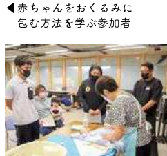
赤ちゃんをおくるみに包む方法を学ぶ参加者

(2人) マタニティカフェに参加して、沐浴や赤ちゃんの抱っこの仕方などを体験したことで、親になる実感が湧いてきて、「早く赤ちゃんに会いたい」という思いが強くなりました。