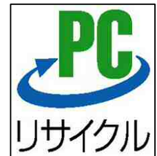
PCリサイクルマーク