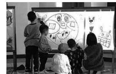
㊦牛深総合センター ☎73-4191（月曜休館）

ゲームコーナーやお楽しみ工作など、楽しいイベントが盛りだくさん。玄関前には出店もあります。 と き 1月14日㊦ 午前10時～午後4時 と ころ 牛深総合センター