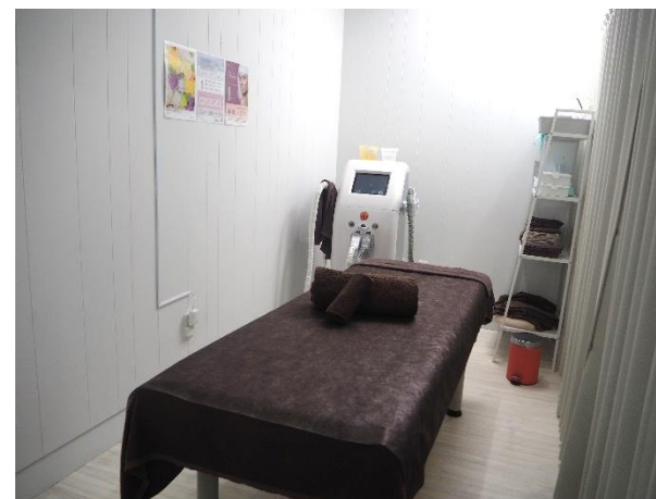
プライバシーに配慮された個室（脱毛用）

また、美容専門学校時代にネイルサロンのアルバイトでお客様に喜んでいただけたことがやりがいにつながった。天草に帰郷後、子育てがひと段落したタイミングで、夢の実現に向けてチャレンジ、令和1年8月に店舗をオープンした。