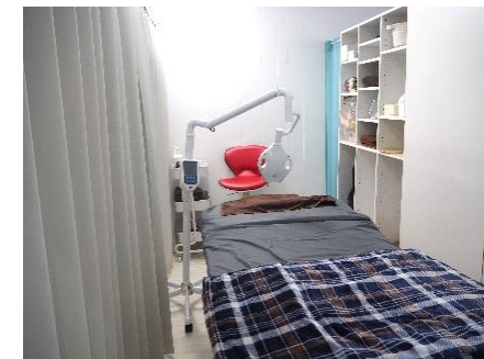
1回の施術で効果を発揮する 歯のセルフホワイトニングマシン