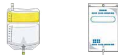
※栄養剤バッグ ※CAPD バッグ