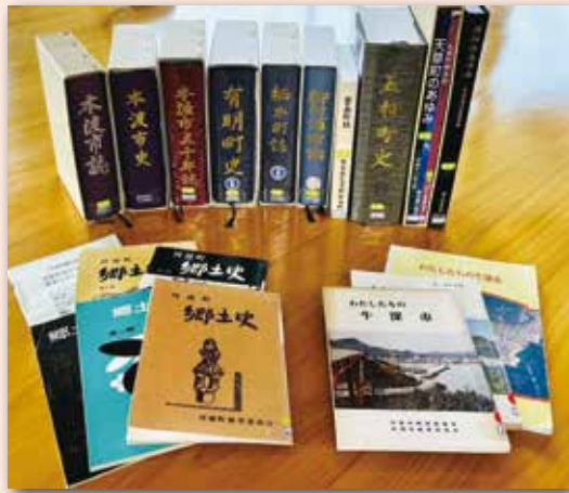
▲旧市町時代に作成された市史・町史