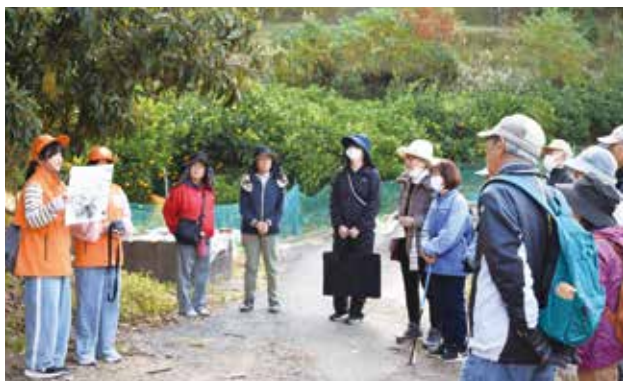
▲有明小ボランティアガイドの案内で、特産のミカン畑や郷土の偉人ゆかりの場所など5.8kmのコースを歩く