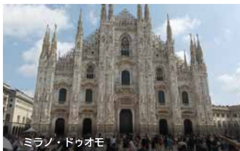
ミラノ・ドゥオモ

今回の研修で「世界を自分の目で見る事の大切さ」を学びました。建造物の大きさや文化の壮大さなど、本やインターネットだけでは分からないことです。自分の五感を通じて、初めて理解できるのだと気がきました。私も天正遣欧使節の4人の少年たちのように、世界に学び、未来に活かしていきたいです。そして、さらにグローバルな視点を培い、成長した姿でまたいつかイタリアを訪れ、今回の思い出を懐かしく感じたいです。