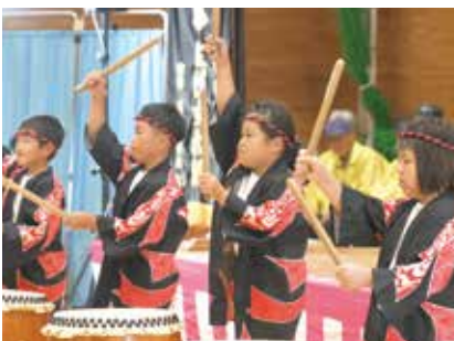
▲倉岳小学校3年生の力強い倉岳えびす太鼓で開演