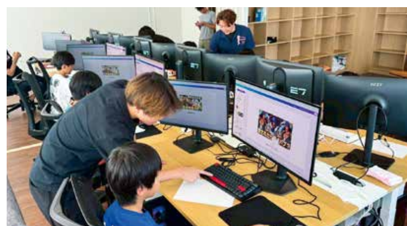
図 産業政策課 ☎ 32-6786

本市では、若い人たちが「働きたいと思える場所」を増やすことで、定住の促進や地域経済の循環を生み出し、創造性豊かなまちづくりを目指しています。 そのために、市外の魅力的な企業にアプローチし、市内に拠点を開設してもらうことで、新たな雇用の場を創出できるよう誘致活動を進めています。 今号では、企業誘致に対する取り組みや成果、天草の持つ可能性などについて紹介します。