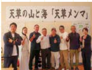
▲開発に携わった皆さんと

福岡県出身。令和6年11月から熊宮地岳で活動。前職は食品会社で商品開発を行う。趣味は、映画鑑賞と料理。