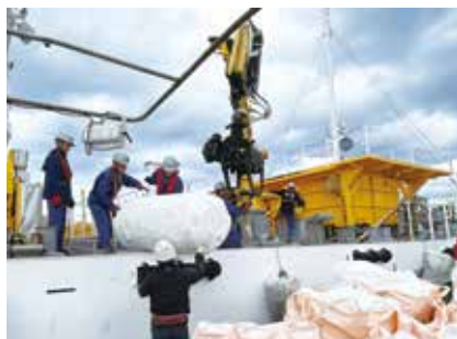
▲調査観測兼清掃船「海煌（かいこう）」と地元の漁船が連携し、流木や漂流物を回収