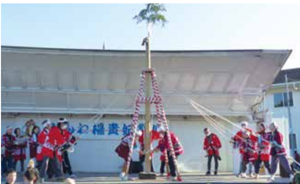
▲祭りのフィナーレを飾った新和町土塙き保存会による土塙き音頭