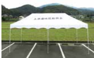
◀アルミワイドテント