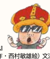
◀『うんこ!』 （サトシン作・西村敏雄絵）文溪堂