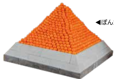
◀ぽんかんピラミッド