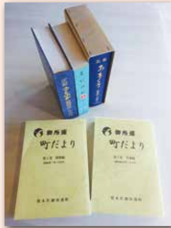
▲合併前に発行された広報縮刷版