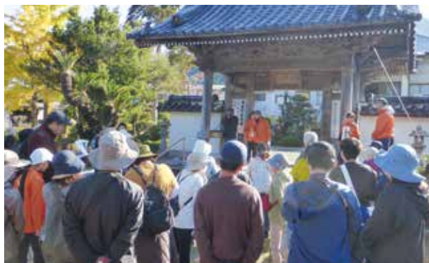
▲寺院や河内浦城跡など、一町田地区の名所・旧跡を巡り、地元小学生の説明を聞いてクイズに挑戦！