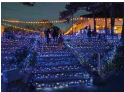
▲マルシェを楽しんだ後はイルミネーションで彩られた海辺を散策