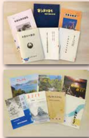
▲当時の市や町を知る資料

本市は、3月27日に市制20周年を迎えます。天草市が誕生する前に2つの市と8つの町があったことはご存じでしょうが、首長の名前や市旗・町旗のデザイン、産業や教育などはどうでしょうか。そんな旧市町時代の情報を知りたいという時に思い出してほしいのが、身近な図書館や図書室です。