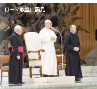
ローマ教皇に謁見