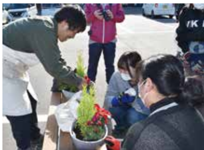
▲ポインセチアやゴールドクレストなどの花をバランス良く配置