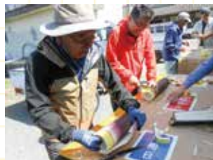
▲放置竹林の解消を目指して