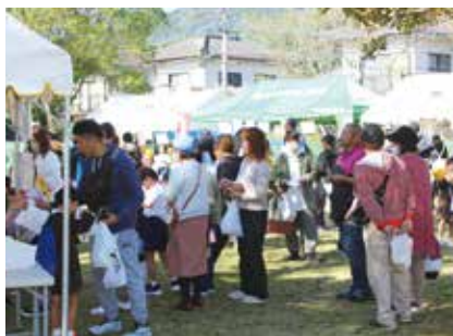
▲快晴の中多くの来場者でにぎわったマルシェ