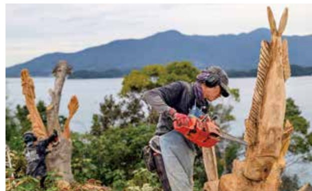
▲3人のチェーンソーアーティストが来島し、恐竜など迫力ある16作品を新たに制作