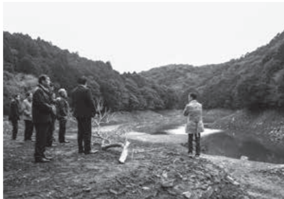
▲楠浦ダムの現地調査