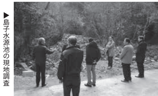
▶島子水源池の現地調査