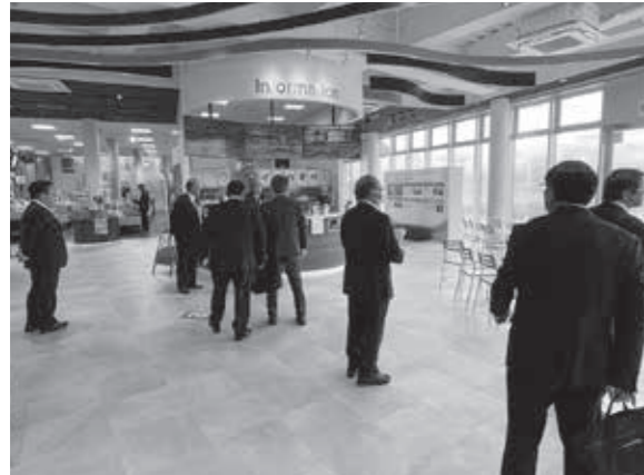
▲天草市イルカセンターの現地調査

建設経済委員会では、令和7年12月1日付で指定管理者の指定が取消され、市の直営となった天草市イルカセンターについて、現地調査など所管事務調査を実施しました。