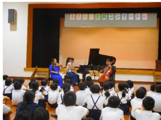
ふれあい出前コンサート