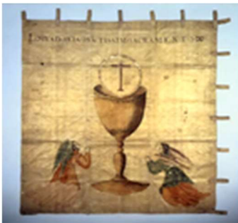
綸子地著色聖体秘蹟図指物 通称：天草四郎陣中旗（本渡）

それぞれの地域には、その地域特有の自然や歴史、貴重な文化財があります。それらを踏まえて、歴史・文化・産業・観光等の総合的な視点から、地域の文化を再発見し、磨き上げ、伝承し、保存して、新しい天草文化の宝になるよう努めます。また、自然資源はその貴重さを地域へ伝えるとともに、保全に努めます。