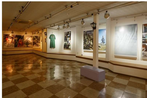
芸術作品展示事業「ギャラリー四季」