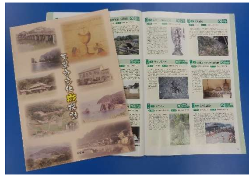
天草市文化財探訪 (ガイドブック)