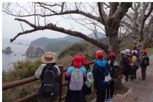
野外での出前授業の様子