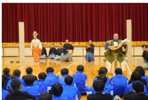
コミュニティ助成事業（能体験）