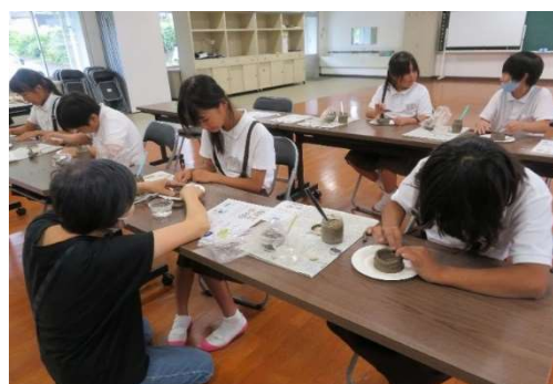
子ども作陶体験事業