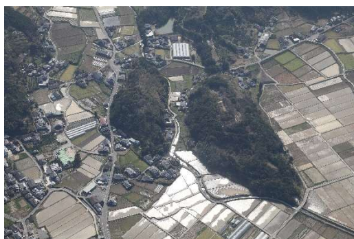
上津浦城跡全景（有明）