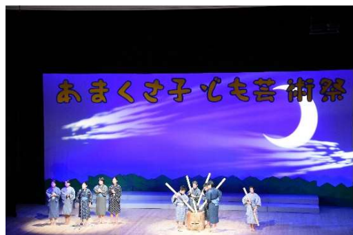
伝統芸能の次世代への継承