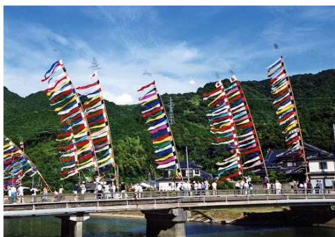
一町田八幡宮虫追祭（河浦）