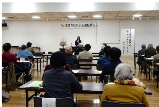
五足の靴顕彰全国短歌大会