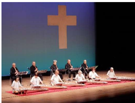
天草市民芸術祭「本渡地区文化祭」