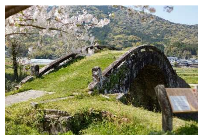
県指定重要文化財 「楠浦の眼鏡橋」(本渡)