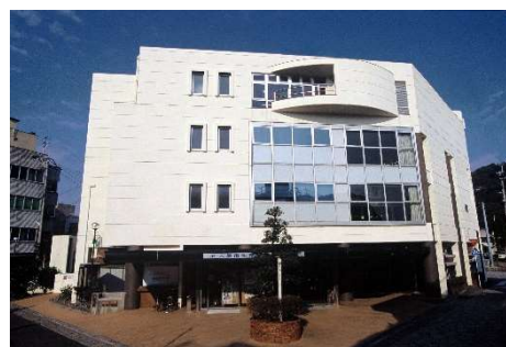
牛深総合センター