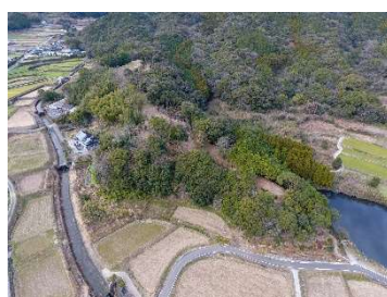
国指定史跡 「棚底城跡」(倉岳)