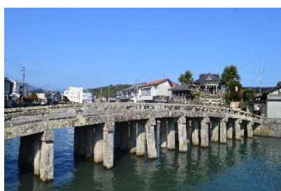
国指定重要文化財 「祇園橋」(本渡)