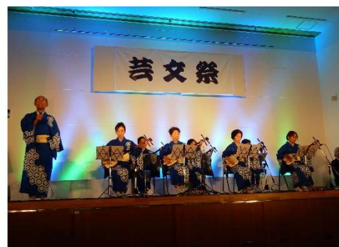
天草市芸術文化祭