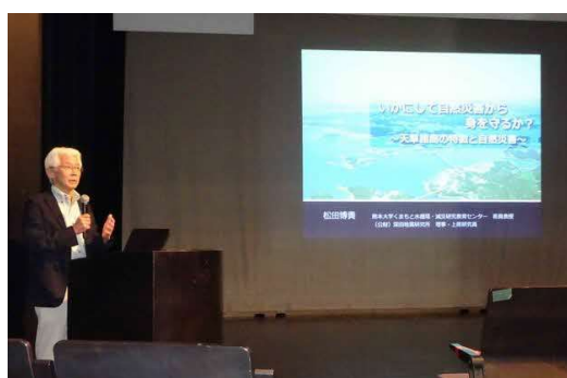
天草の自然を知る講演会