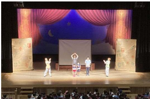
天草市民センター 文化事業