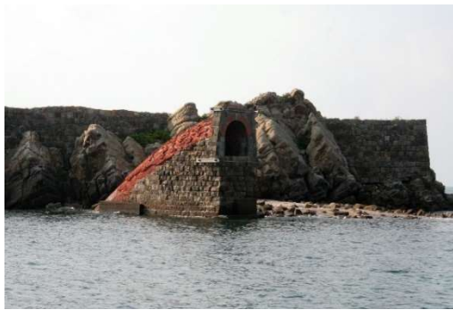
市指定文化財「烏帽子坑跡」(牛深)