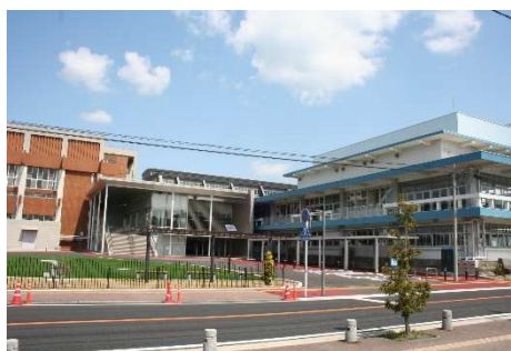
天草市民センター

さらに、天草市民センターと牛深総合センターは、平成29年度からの指定管理者制度導入により、管理運営の効率化、舞台技術の向上だけでなく、円滑な施設運営ができており、市民サービスの向上が図られ、文化活動等の啓発も促進されています。