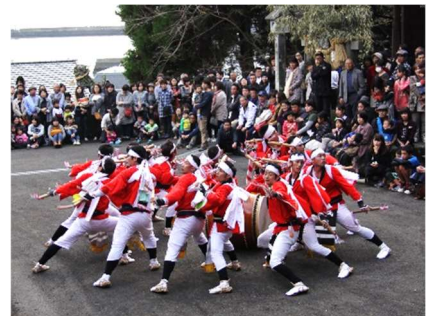
栖本太鼓踊り（栖本）