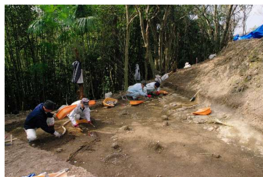
埋蔵文化財の確認調査の様子