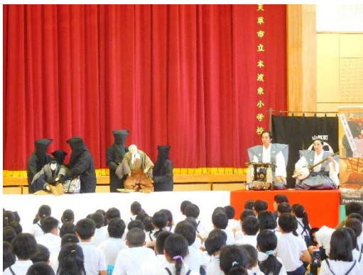
いきいき芸術体験事業