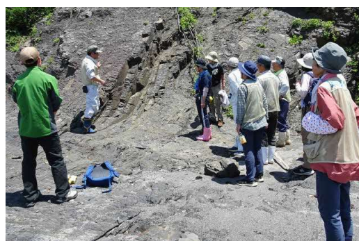
学術支援事業で野外の地層解説