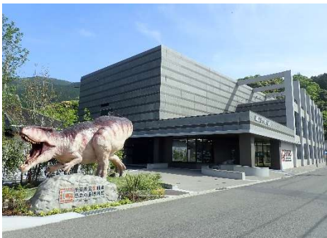
御所浦恐竜の島博物館