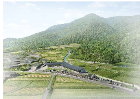
天草戦国ミュージアムイメージ図