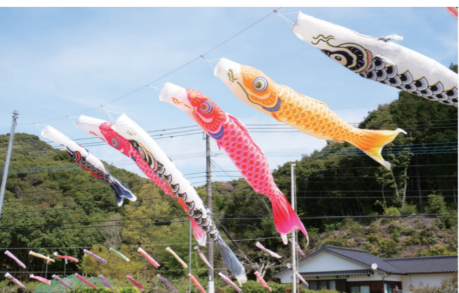
二浦町早浦区で元気に泳ぐこいのぼり▶