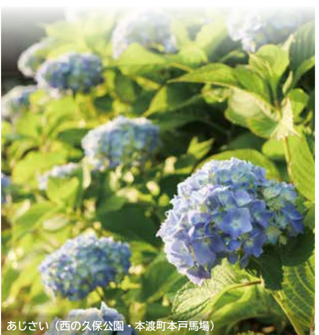
あじさい(西の久保公園・本渡町本戸馬場)