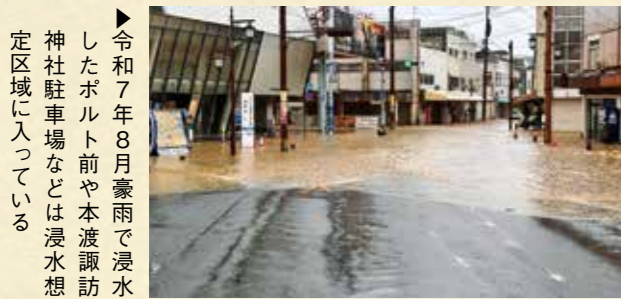
▶令和7年8月豪雨で浸水したボルト前や本渡諏訪神社駐車場などは浸水想定区域に入っている

海が近いので、大雨や台風の際はスマホのアプリで潮見表をチェックしたり、津波警報が出たときなどは避難したりしたこともありましたが、浸水は想定していませんでした。どこか人ごとだと思っていたのだと思います。やはり早めの避難が大切ですね。