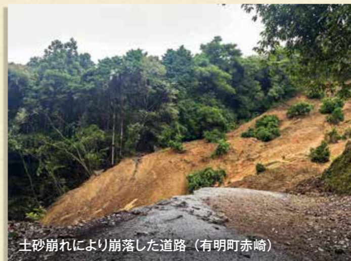
土砂崩れにより崩落した道路 (有明町赤崎)