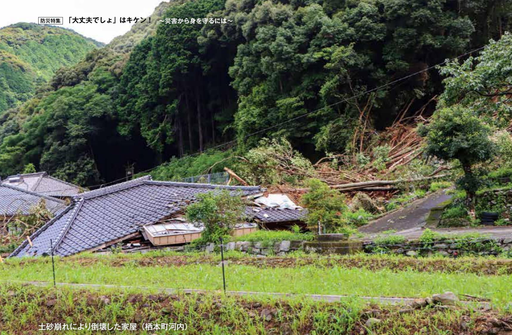
土砂崩れにより倒壊した家屋 (栖本町河内)