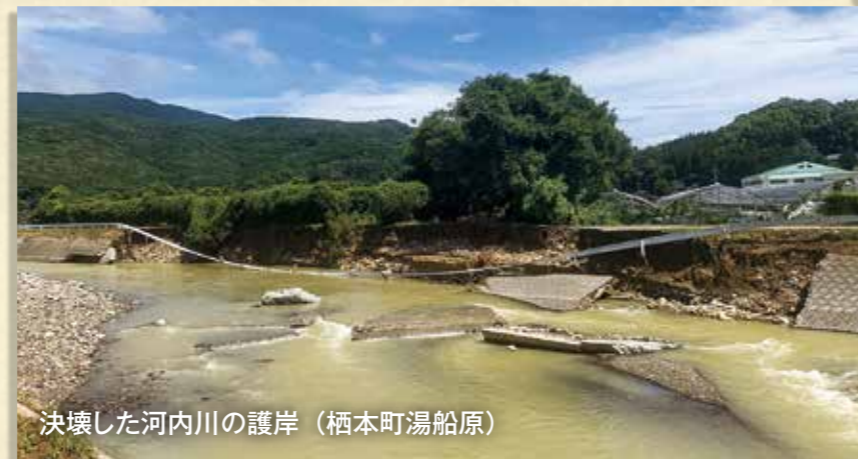
決壊した河内川の護岸 (栖本町湯船原)