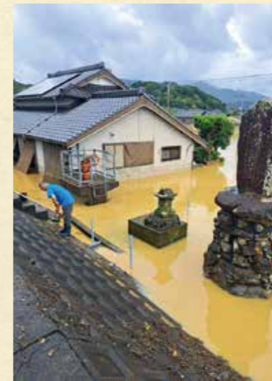
▲浸水した自宅周辺。水門に詰まっていた流木などを取り除くと水が引いた

11日の朝7時30分頃、普段は大雨でも浸からない自宅前の道路が浸かり始め、「いつもと違う」と感じ、少し高いところにある元農協前の倉庫に妻と避難しました。その後、周辺の道が浸水して自宅に近づくことができず、被害状況を知ったのは水が引いたその日の夕方。自宅は床上40cmまで水に浸かり、畳は浮き上が ってタンスは倒れ、小屋の農機具も全て駄目になりました。その時は「もうここには住めない」と思いました。断水しなかったおかげで家の中は水で流すことができましたが、再び住めるようになるまでかかったのは2カ月半。片付けを手伝ってくれた息子たちや親戚・知人の皆さんにはとても感謝しています。 海が近いので、大雨や台風の際はスマホのアプリで潮見表をチェックしたり、津波警報が出たときなどは避難したりしたこともありましたが、浸水は想定していませんでした。どこか人ごとだと思っていたのだと思います。やはり早めの避難が大切ですね。