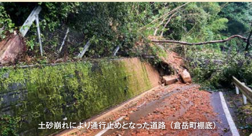
土砂崩れにより通行止めとなった道路 (倉岳町棚底)