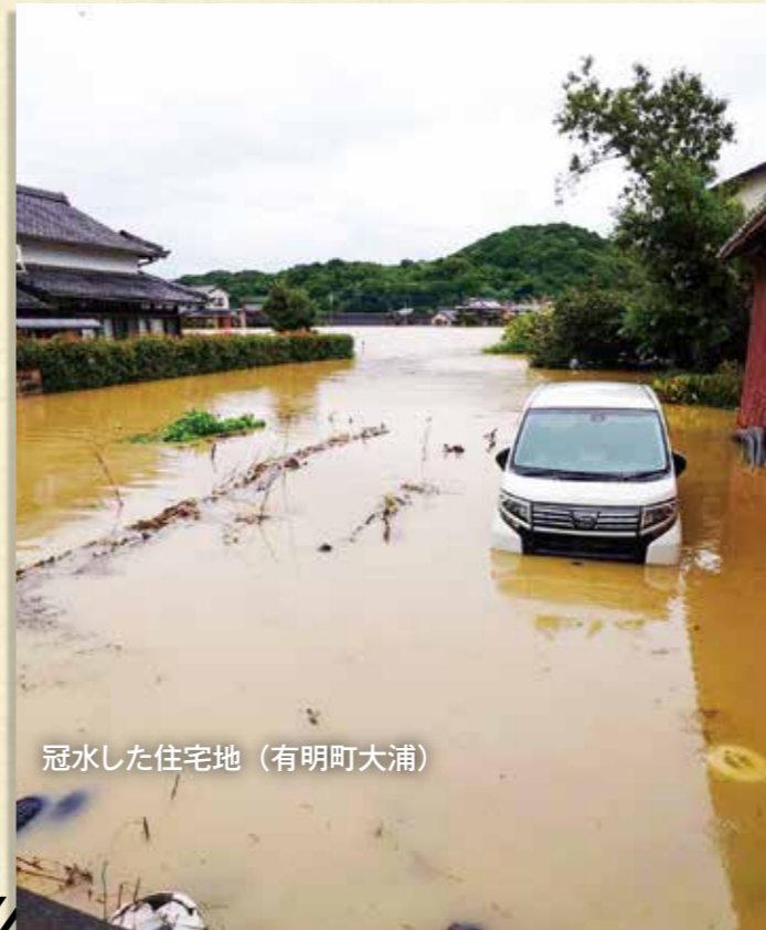
冠水した住宅地 (有明町大浦)