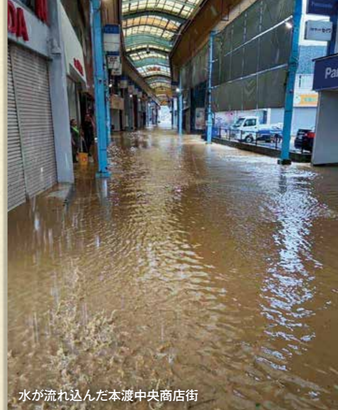
水が流れ込んだ本渡中央商店街