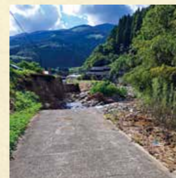
▲崩落した家の前の道路