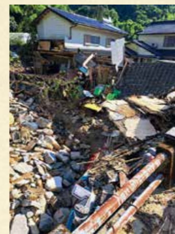
▲土砂が堆積した宗土岐川と流された小屋の一部