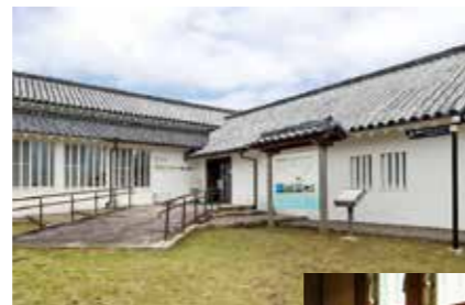
「本丸多門櫓」を再現した風格ある外観

国立公園の豊かな自然や歴史、文化を深く知ることができる拠点です。富岡城の本丸跡に建つセンターは、かつての「本丸多門櫓」を再現した風格ある外観が目印。最大の見どころは、3面スクリーンで天草の海を体感できる「天草海中体験シアター」です。東シナ海や有明海、八代海という周囲を囲む3つの海それぞれの個性を、美しい水中映像で楽しめます。他にも、国内外の国立公園を紹介するモニターなども人気があります。