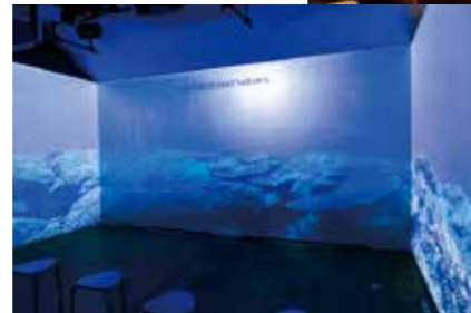
天草海中体験シアター ※機器不良のため現在利用できません。