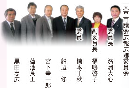
天草市議会広報広聴委員会