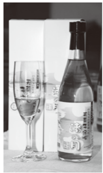
◀「天草宝島ワイン・リキュール特区」を利用して作られた梅酒

市は、国の構造改革特別区域法の規定に基づいて「天草宝島ワイン・リキュール特区」の認定を受けていますが、平成22年11月30日付で特区の対象(リキュールのみ)として、新たに12品目の農産物が認定されました。今後、多種多様なリキュールを製造・販売することで、地域農産物の消費拡大と地域経済の活性化を図ることを目的としています。