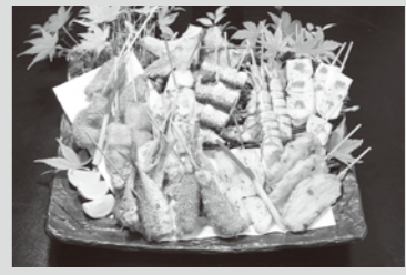
新作メニューの「魚串」

天草の旬の食材や食の魅力を一堂に集めた「天草食の祭典2011」を開催します。天草オリジナルの新作メニューをはじめ、海鮮丼、豪華炭火焼、旬の海鮮、産直野菜の直売や、ステージイベントなどが盛りだくさんです。豪華賞品が当たる抽選会や、温泉割引券のプレゼントなどもありますので、ご家族やお友だちで、ぜひご来場ください。