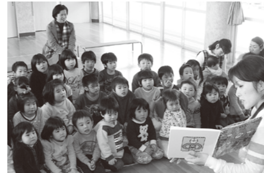
絵本の話に聞き入る子どもたち