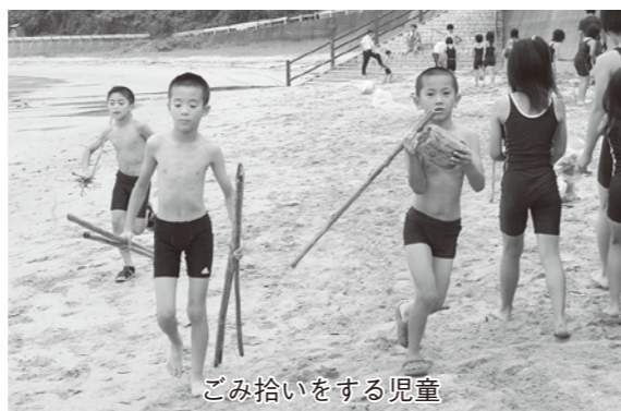
ごみ拾いをする児童