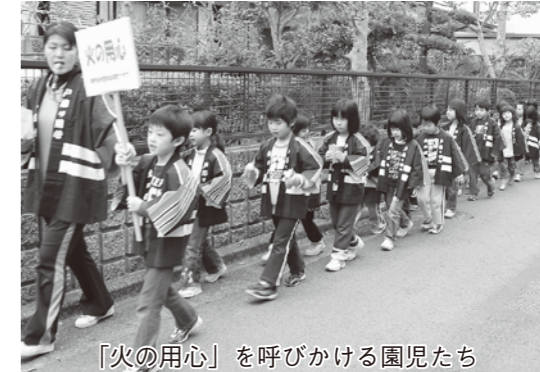
「火の用心」を呼びかける園児たち