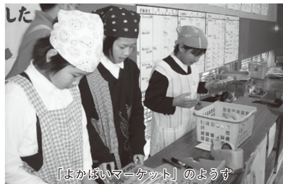
「よかばいマーケット」のようす

下浦第一小学校には、ほかの学校にはない行事が二つあります。一つ目は「よかばいマーケット」です。これは、家族や地域の人たちを招いてバザーを行う、PTAの行事です。手作りの商品や料理、リサイクル品などを、私たちが接客のお手伝いをして販売しています。もう一つは、ひとり暮らしのお年寄りの人たちに、学校で育てた花の苗をプレゼントして回る「花の苗プレゼント」です。毎年、皆さんの笑顔を見るのが楽しみです。どちらの行事も、地域の皆さんとたくさんふれあうことができる楽しい行事です。私たちの学校は、人数は少ないですが、みんな仲が良く団結力ではどこにも負けない自慢の学校です。