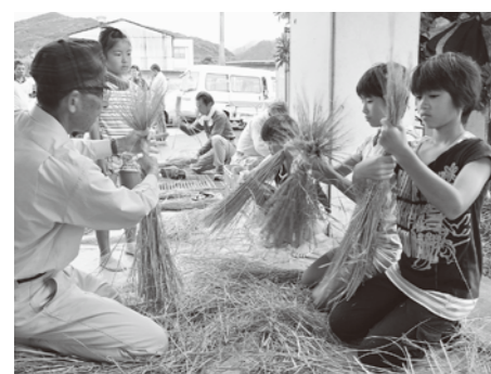
▲「十五夜事業」で綱のない方を教わる子どもたち

今年8月には、4年生以上の児童を対象にした、御所浦民泊体験事業を初めて実施。民家に宿泊しながら魚釣りや化石採集などの体験を通して、子どもたちはひと回り成長したように感じています。今後も、島子で育った子どもたちの笑顔がいっぱいで、ふるさとに感謝できる地域を目指して活動していきます。