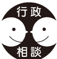
▲行政相談 シンボルマーク

行政に対するご意見や要望、苦情などを、総務省から委嘱された行政相談委員がお聞きします。相談は無料で、秘密は固く守られます。皆さん、お気軽にご相談ください。