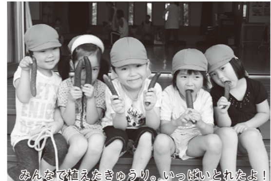
みんなで植えたきゅうり。いっぱいとれたよ！

そのほか、特別講師による毎月2回の「英語で遊ぼう」、子育て支援サークル「げんきっずクラブ」の活動も活発で好評です。