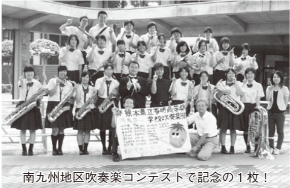
南九州地区吹奏楽コンテストで記念の1枚！

◆健康の秘けつは？ 食事は、自分の畑で作った野菜などを中心に食べ、量も腹八分を心がけています。また、無理をしない程度の適度な運動も大事。でもいちばんの健康法は、毎日を笑顔で過ごすことだと思います。