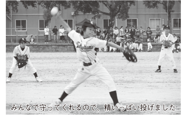
みんなで守ってくれるので、精いっぱい投げました

僕たちの目標は、7月の五和大会で1勝することでした。僕は部活動が終わった後、お父さんとピッチングの練習をしました。お父さんがいつも言うのは「うでをしっかりと回せ」です。それをずっと続けていると、いいボールがたくさん入るようになりました。試合当日はとても緊張しましたが、練習どおりうでをしっかりと回して投げました。すると、緊張もなくなり、三振や内野ゴロがたくさんとれ、バッティングではタイムリーツーベースを打ちました。試合にも勝つことができ、みんなで喜びました。そして、お父さんから「がんばったなあ」と言われました。目標のために今まで練習してきた、本当によかったです。