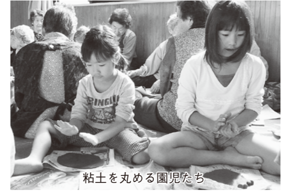
粘土を丸める園児たち