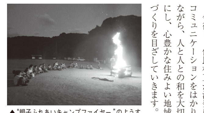
▲「親子ふれあいキャンプファイヤー」の様子

このような中、二浦地区振興会では、地域の自然を守るための、河川の浄化活動や、みんなが集い楽しむ親子ふ