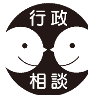
▲行政相談 シンボルマーク

行政に対するご意見や要望、苦情などを、総務省から委嘱された行政相談委員がお聞きします。相談は無料で、秘密は固く守られます。皆さん、お気軽にご相談ください。