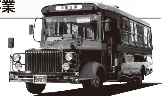
▲一部の運行に導入されている情緒たっぷりのボンネットバス