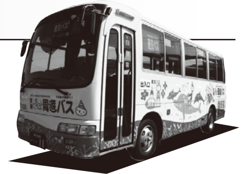
▲天草ぐるっと周遊バス