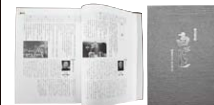
◀閉校記念誌「白はと」

今後、閉校を迎える学校があると思いますが、閉校記念誌などを制作される際には、ぜひ利用していただければと思います。