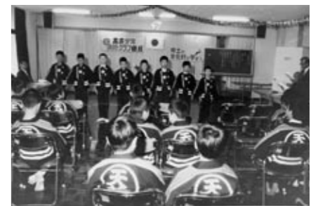
▲少年消防クラブ結成 (昭和52年)