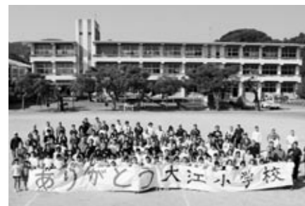
▲最後の運動会終了後の記念写真

ありがとう、さようなら高浜小学校 今の新しい高浜小学校ができた年に、ほくたち4人は入学してきました。あれから6年、今度は高浜小学校の閉校とともに卒業することになりました。ピッカピカのきれいで明るい校舎は、ほくたちの自慢です。毎日ここで勉強や運動ができたことに感謝しています。中学校へ進学しても、高浜小でのたくさんの思い出を大切にしていきたいです。