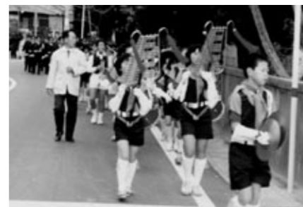
▲消防クラブ鼓笛隊 (昭和57年)