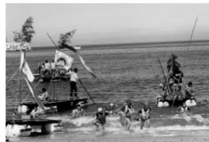
▲いかだくんだり (平成12年)