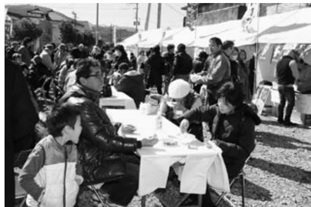
▲にぎわいを見せた本渡港特設会場