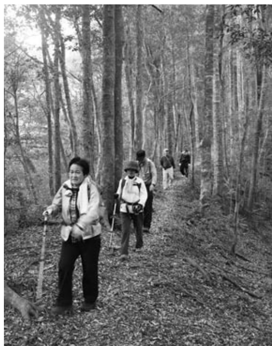
◀遊歩道を歩く参加者

参加者は、天然の檜の木がそびえ立つ森の中を、思いおのいのペースで登山。山頂では見下ろす景色を背にして、記念撮影をするなどして楽しんでいました。また、下山後同公園で景品が当たるお楽しみ抽選会も行われ、にぎわいを見せていました。