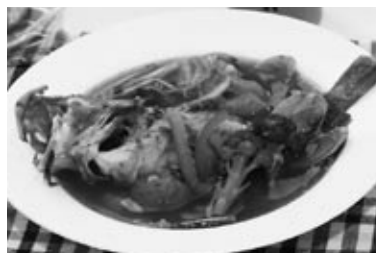
◀オリーブ料理のひとつ “地魚のピヤベース”