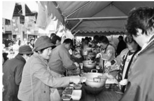
▶「うしぶか海食祭2013」 で料理を買い求める来場者