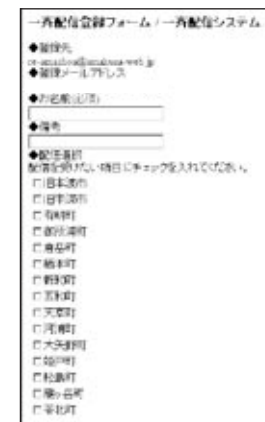
▲登録画面イメージ