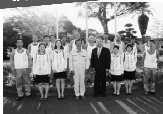
天草設備(株)安全衛生協力会