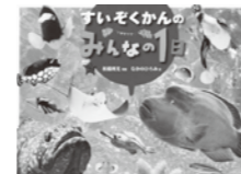
すいぞくかんのみんなの1日 松橋利光