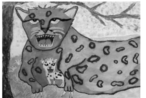
作品名「幸せな親子」