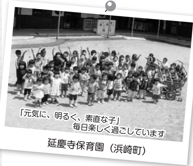
「元気に、明るく、素直な子」 毎日楽しく過ごしています