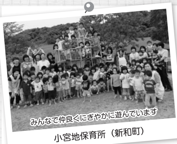
みんなで仲良くにぎやかに遊んでいます