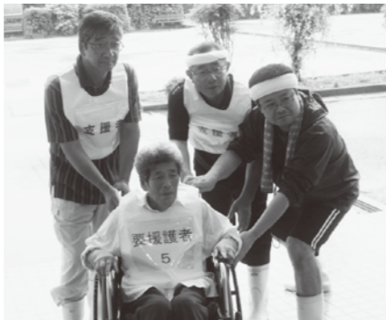
▶同補助金を利用して購入した 資機材(車椅子など)を使用し て行われた防災訓練のよう です。

自主防災組織設立促進・活動 活性化事業補助金について 市では、自主防災組織(※) の新規設立や同組織の訓練実 施に必要な経費に対して、補 助金を交付しています。 この補助金は、地域防災の 中核となる自主防災組織の設 立促進と、活動の活性化によ る地域防災力の向上を目的に 交付するものです。