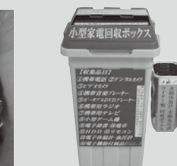
▲小型家電回収ボックス