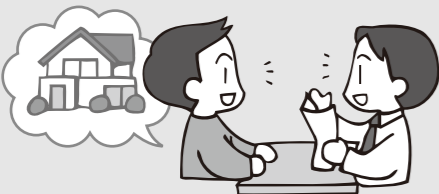
図 本庁・地域政策課