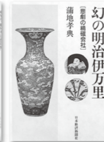
幻の明治伊万里 悲劇の精磁会社 蒲地孝典