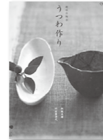
うつわ作り -趣味の陶芸 新堀恵理ほか

陶磁器は、見るもよし、作るもよし、知識を深めるもよし。さまざまな楽しみ方があります。今回は、陶磁器の本をご紹介します。