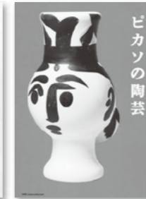
ピカソの陶芸 パブロ・ピカソ