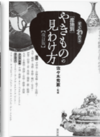
すぐわかる産地別やきもの見わけ方(改訂版) 佐々木秀憲