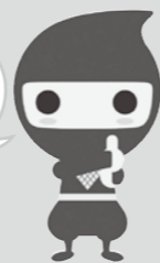
給付金イメージキャラクター 「カクニンジャ」