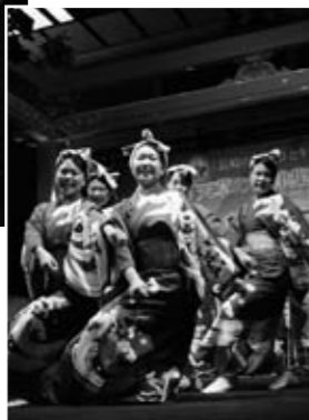
▶牛深高校・郷土芸能部の皆さん