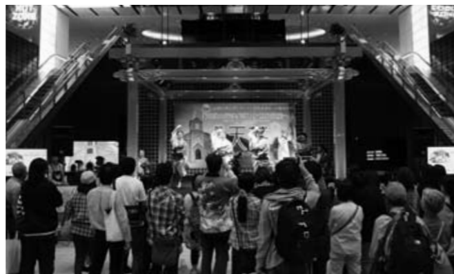
▲PRイベントのようす

同ターミナルは、世界各国と日本を結ぶ国内有数の空の玄関口。多くの日本人や外国人たちが集う場所です。会場には、天草の崎津集落をPRする高さ2.5m・幅4.5mのタペストリーやパネルを設置したほか、映像作品も放映。訪れた人たちは、タペストリーをバックに記念撮影をしたり、パネルや映像に見入ったりしていました。