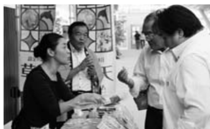
▲天草の特産品の販売