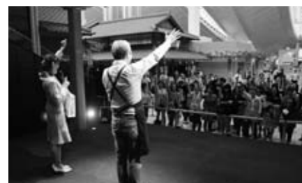
▲天草の特産品が当たる抽選会