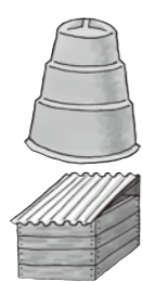
▲非電気・バイオ式

②電気・乾燥式:ヒーターや温風などで生ごみを乾燥させ減量化する。土と混ぜ肥料にすることもできる。