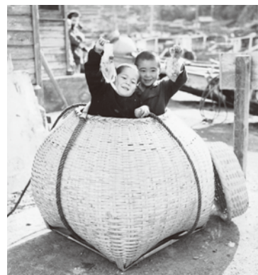
▲かごで遊ぶ子どもたち