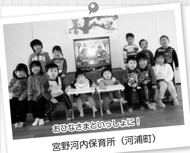
おひなさまといっしょに! 宮野河内保育所 (河浦町)