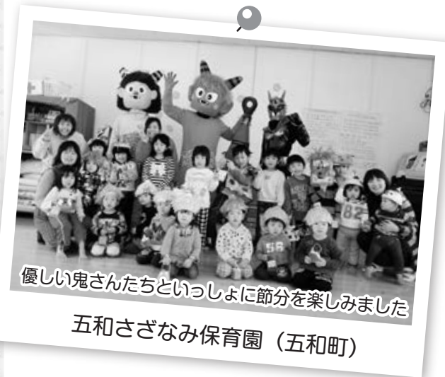
優しい鬼さんたちといっしょに節分を楽しみました 五和さざなみ保育園 (五和町)