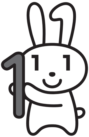
マイナンバーキャラクター マイナちゃん

住民登録をしているすべての人に12けたの番号を付ける、『マイナンバー制度』。いよいよ10月中旬から11月にかけて、マイナンバーが記載された「通知カード」が住民登録をしている住所地に届きます。