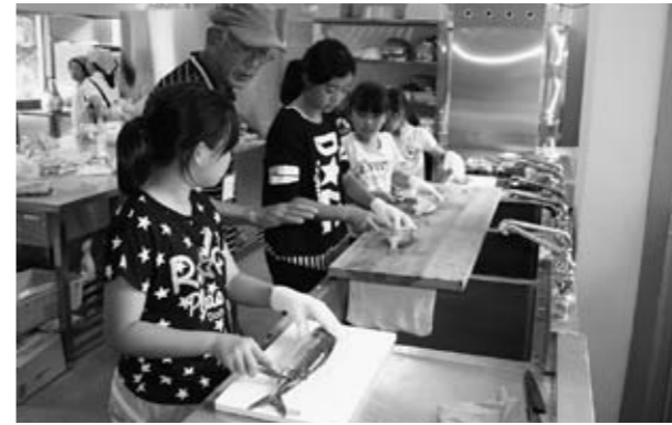
▲魚さばき体験でウロコを取る児童たち

9月29・30日、山鹿市の小学生27人が「ふるさと生活体験」で御所浦町を訪れました。御所浦アイランドツーリズム推進協議会が受け入れたもので、“感触・感謝・感動”をテーマに、民泊や化石採集、船釣りなどを体験。船釣り体験では大物のココダイなどが釣り上げられ、帰港後は地元漁師などの指導を受けながら魚さばきにけんめいに取り組むなど、御所浦町の生活を満喫していました。