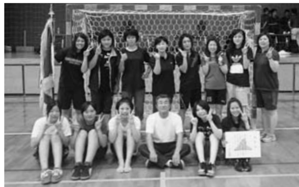
▲優勝したハンドボール女子チームの皆さん

9月12・13日、「第70回熊本県民体育祭熊本市大会」が開かれ、市チームは総合6位、女子総合は初の3位に入賞しました。大会には、県内20郡市から7,251人が参加。市からは23種目・31競技に402人が出場し、ハンドボール女子が優勝、陸上競技男子・ハンドボール男子・剣道・空手道・グラウンドゴルフ女子が2位に入るなど健闘しました。来年は阿蘇地域で開催されます。