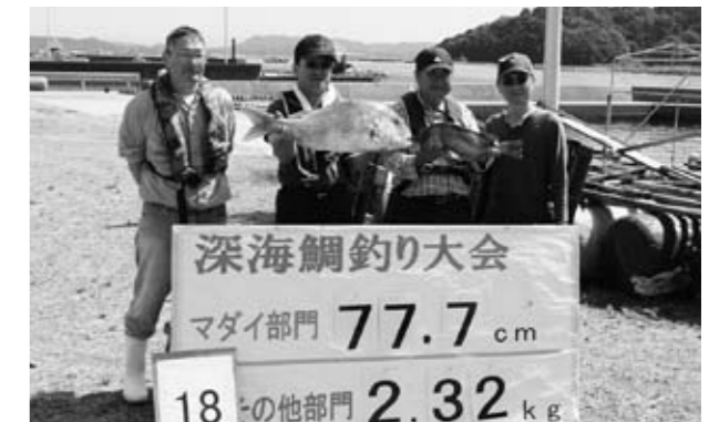
▲釣り上げたマダイを手にする参加者

マダイの好漁場として知られている深海町沖合いで10月3・4日、深海地区振興会主催による「第9回深海鯛釣り大会」が開かれ、48チーム・200人が参加しました。多くの人に鯛釣りを楽しんでもらおうと毎年開催しているもの。4～5人の1チームの中から釣り上げたタイの長さや重さが競われ、今回は最大77.7cm、5.74kgのマダイが釣り上げられるなど、参加者は釣りを満喫していました。