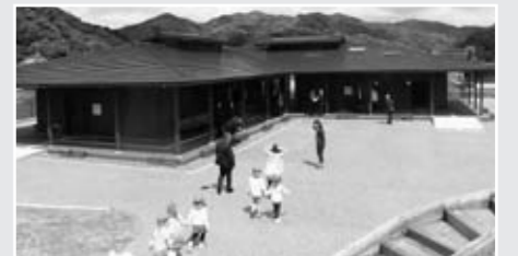
▲崎津集落ガイダンスセンター

河浦町崎津に整備していた“崎津集落ガイダンスセンター”が4月28日(土)にオープンしました。当施設は崎津・今富の歴史や集落の見学マナー、崎津教会の拝観マナーを来訪者へ周知する崎津・今富の観光窓口となります。施設内では、市内の特産品の販売や、崎津案内ガイドの受付も行っています。崎津・今富にお越しの際は、ぜひお立ち寄りください。