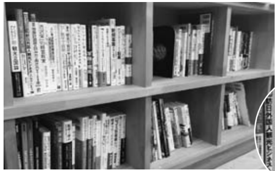
▲ビジネスに役立つ図書をそろえています

な相談に対して、情報の提供も行っています。具体的に相談することがなくても、何かしらのヒントが得られると思いますのでお気軽にお立ち寄りください。