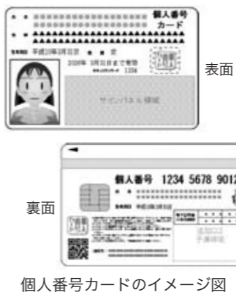
個人番号カードのイメージ図

答 行政手続における特定の個人を識別するための番号の利用等に関する法律、いわゆる番号法(マイナンバー制度)の施行に伴い、住民票を有するすべての国民に対して12桁の個人番号が付され、番号法の趣旨に沿った、より厳格な保護措置を講ずるため、条例を改正するものである。