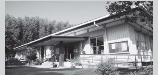
▲本渡老人福祉センター

市では、10年後の天草市を見据えた持続可能な行政運営を確立するために策定した「第1次天草市行政改革大綱」に基づき、民間活力の活用を図るため次の施設の「指定管理者」を募集します。