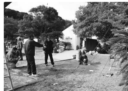
▲飾り付けは光のバランスを考えて