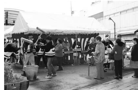
▲もちつきの音に、道行く人は足を止め、つきたてのもちを買い求めていました