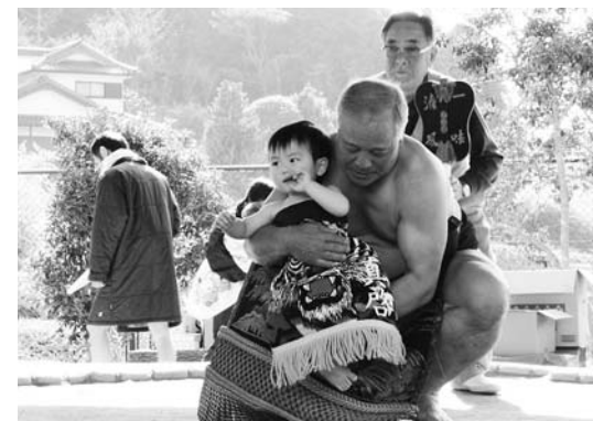
▲赤ちゃんも化粧まわしをつけて堂々の土俵入り