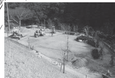
▲3月12日現在の整備状況

下田温泉街の玄関口の一つとなる「さくら公園」には、温泉街のイメージアップを図るため、ソメイヨシノやシダレザクラなど4種類の桜をはじめ、ツバキやアジサイなど8種類の花を植栽。四季折々に咲く、さまざまな花をお楽しみいただけます。