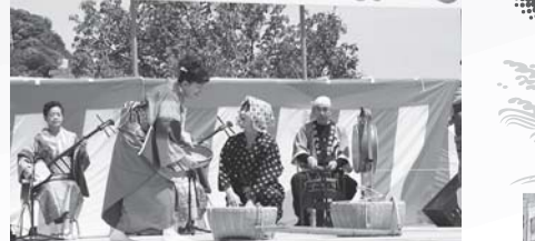
▲にぎわったお祭り野外ライブ