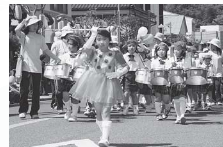
▲子どもたちが元気よく商店街などをパレード