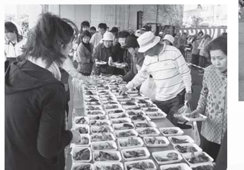
▲水産フェアでは刺身やあら煮など1,200食分が完売