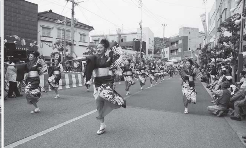
▲踊りハイヤ大賞に輝いた芥明高校郷土芸能部