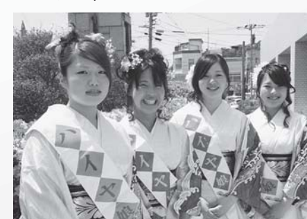
▲ハイヤ娘の4人が祭りを盛り上げました