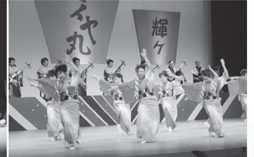
▲輝けハイヤの競演には10団体が出演し、ハイヤ踊りや三味線の演奏などを披露！