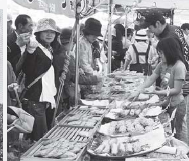
▲大盛況の牛深名産ハイヤ市