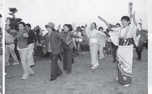
▲ハイヤ踊り講習会も実施