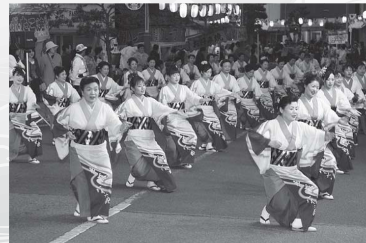
▲ハイヤ総踊りには2日間合わせて49団体・約3,300人が参加！