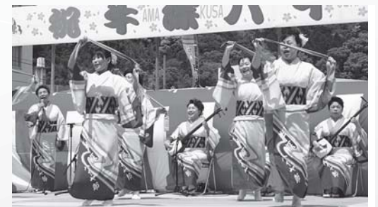
▲ハイヤ記念式典では牛深ハイヤ保存会が踊りを奉納